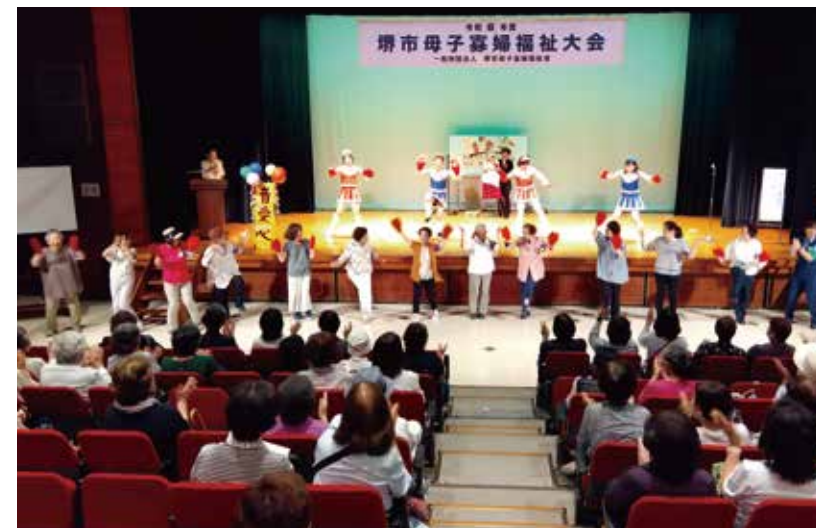
エンディングは全員で盛り上がりました!